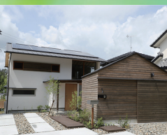
優秀賞 「だんだんの家」 (設計・施工:株式会社 四方館)