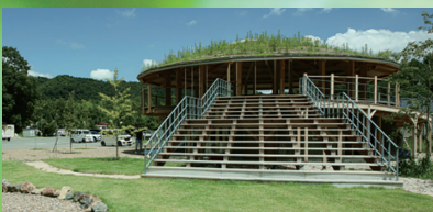
最優秀賞 「pucapuca commune」 (設計・施工:株式会社 MuFF/COCCA+あかい工房)