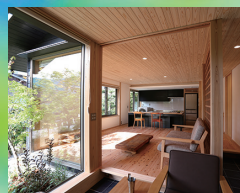
優秀賞 「文藝酒場ちろり」 (設計・施工:株式会社 山弘)

詳しくは『地域材利活用建築デザインコンテスト in 兵庫 運営事務局』までお問い合わせください。TEL:0790-64-0150(月~金 10:00~16:00)